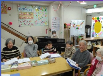
「歌の会」 昭和歌謡の人気曲を中心に、 ピアノを弾いて下さいました。