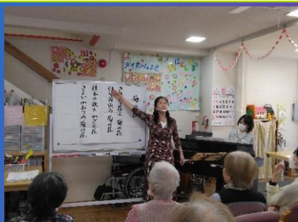
「リトミック」 秋に関する曲を、皆で元気良く 歌いました。